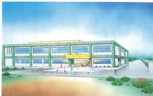
4代目校舎完成イメージ図（当時）

さて、6月6日（土）には運動会、10月24日（土）には学芸会、そして11月22日（日）には閉校記念式典を予定しています。現在、実行委員会を中心に準備を進めております。浜松小学校最後の記念行事となりますので、ぜひ多くの地域の皆様に足を運んでいただければ幸いです。