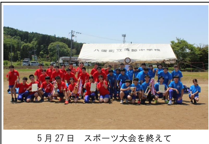
5月27日 スポーツ大会を終えて

学校だよりの「巻頭言」を書く時には、必ず前年同月の文章を読み返します。そのたびに思うのは「昨年度は“キツイ”文章を書いていたな」ということです。昨年度は、学校の、生徒の状況を改善したくて、意識的に保護者の皆さんに「学校を改善してこういう子どもを育てたいので協力をお願いします！」という強めのメッセージを送っていました。それに比べて、今年度は“柔らかな”文章を書くことができるようになりました。校内外での生活の様子は昨年よりも格段に落ち着いてきたと感じているからです。