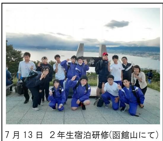
7月13日 2年生宿泊研修(函館山にて)

近くなりましたら改めて学校だよりと「コミュニティ・スクールだより」でお知らせします。一人でも多くの皆さんに来校していただき、「チーム落部」として子どもたちを育てることに御協力をお願いいたします。