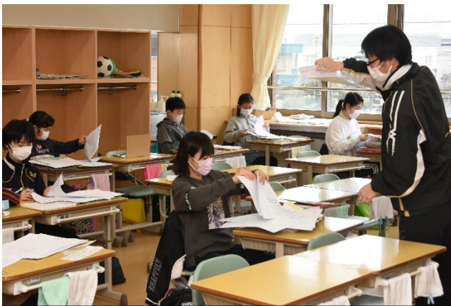
つかの間の学校を味わう分散登校

そして、そんな未曾有の事態でも、子供たちのために協力して取り組んでくれる本校職員には、感謝とともに、頼もしささえ感じるのです。