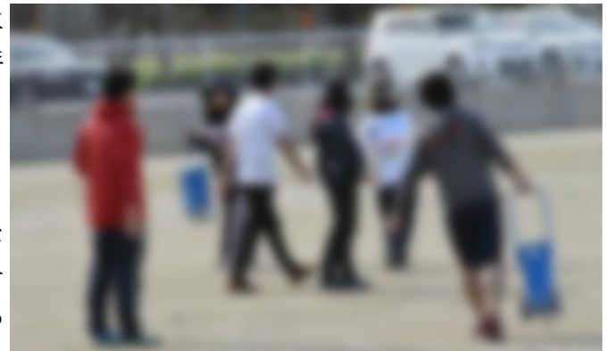
綿密に立てた計画に従って運動会準備をする先生方

本校には、教務、研究、文化、生徒指導、保健体育、支援、事務の7つの部があり、先生方は、子供たちのノートの確認や○付け、次の日の授業の準備や成績処理などの学級の仕事と並行しながら、学校全体にかかわる計画や準備、研修会など、学校が組織として機能するための仕事もしており、時には遅くまで残って仕事をする場合があります。