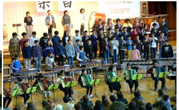
6年生 器楽合奏「威風堂々」