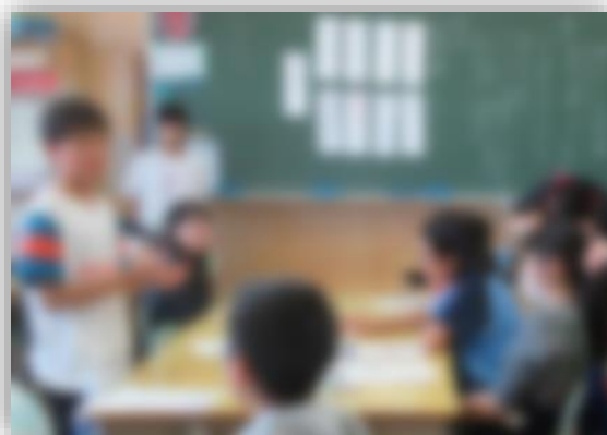
★6年生の学級会の様子。熱く自分の考えを発表しています。司会や記録の仕事も自分たちで。

子どもたちが「勉強をやらされている…」と感じるのではなく、「もっと自分の考えを伝えたい!」「伝えるって楽しい!」と思えるような授業を目指し、互いの授業を参観し合い、成果と課題について話し合っています。その内容は、授業の流れについてはもちろん、使用した教材、教師が投げかけた言葉の一つ一つにまで及びます。よかった点は全学級で共有し、改善すべき点はみんなで案を出し合って、「明日の授業をよりよいものに」と取り組んでいるところです。