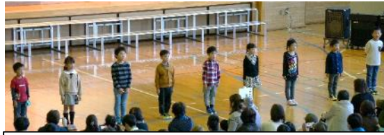
1年生 はじめの言葉

子供たちは、大勢の保護者の方を前にして発表したことで、自信をつけたことと思います。発表までの、友達と協力し合いながら、たくさんの練習を重ねて学んできたことを、今後の学校生活で、生かせるように、続けて指導を重ねていきます。