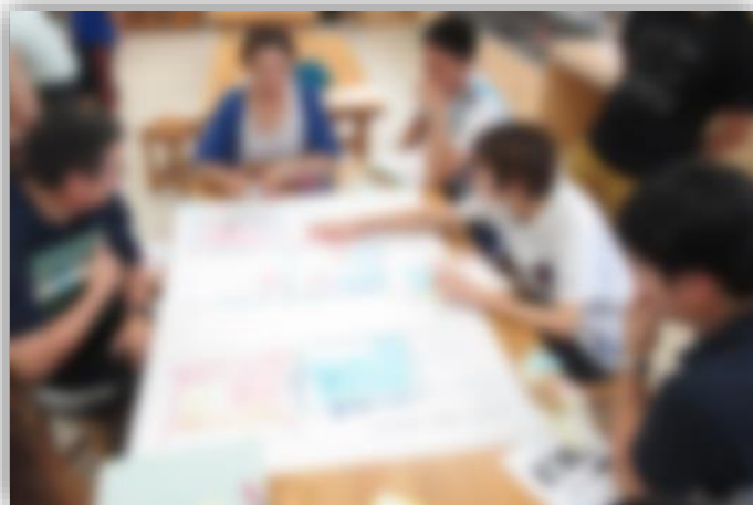
★「事後研」と呼ばれる、授業改善に向けての教員同士の話し合いです。グループごとに意見を書きだした模造紙を囲み、真剣に議論します。