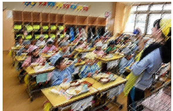
「おいしいね！はい、チーズ！！」