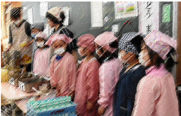
「ちゃんとできるかなあ…」

15日(月)から1年生の給食が始まりました。担任の先生から身支度や配膳の仕方を聞いた後、さっそく準備をしました。初めての給食のメニューは、米飯・牛乳・さつま芋と小松菜のみそ汁・いわし生姜煮・切干大根のカレー炒めでした。苦手な食べ物でも頑張って一口でも食べようとする姿が見られ、大変微笑ましかったです。