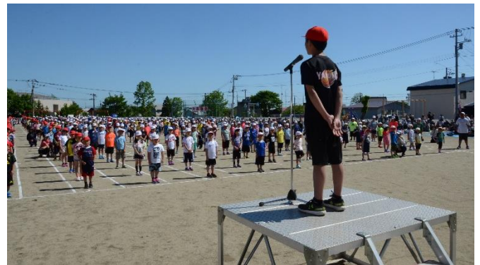
見事な開会式の整列の風景

さて、その運動会も、学校の授業時数の確保のため午前開催とする学校も出てきています。弁当作りが大変という観点ではなく、子供の成長のための教育にとって何を大切にするかという観点で、保護者の皆様の意見も聞きながら、その在り方を検討したいと考えます。PTA 役員会でアンケート実施の助言をいただき、皆様のご意見をお伺いすることといたしました。