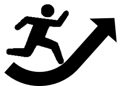
新事業へのチャレンジ