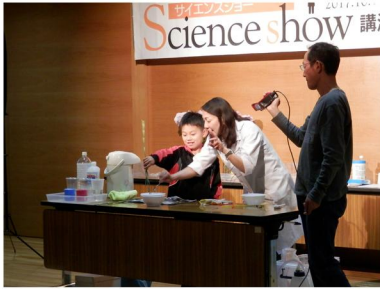
「図書館フェスティバル」の様子 (10月)