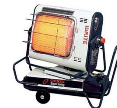
【写真はイメージです】