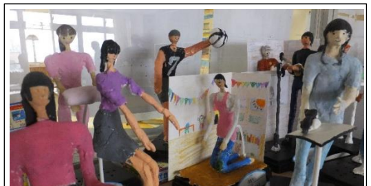
6年生、図工の作品。獣医・保育士・助産師・美容師・スポーツ選手…。カラフルな将来です。

しかし、調査を行ったのは4月です。春も夏も秋も、日々の学習に真剣に取り組み、学びに向かう力を高めてきました。自分を見つめ、仲間のよさを認め、学習発表会の劇では将来の夢を堂々と語る事ができた6年生。今なら違う結果が出ることでしょ。『6年生』から『卒業生』へ自信をもって衣替えをしてほしいと思います。そして、他の学年も 進級に向けたチャレンジ を始めてほしいです。