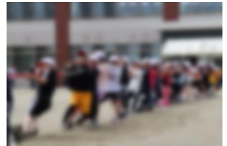
3年生 バトルロープチャレンジ