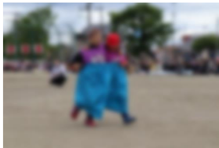
2年生 なかよくデカパンリレー