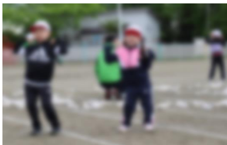
1年生 チェッコリ玉入れ