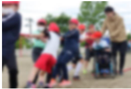
5年生 ヒッパリ!~6月の陣in/雲