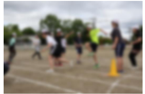
6年生 ジャンプバトルライマックス