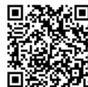
申請用 QR コード

◇電話・窓口申請…WEB申請が難しい場合は、窓口にお越しいただくか、下記のお問合せ先までお電話ください。