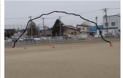
黒線ほどの大きな雪山が先日までありました。

6月4日(土)の運動会実施に向けて着々と準備を進めています。グラウンドの巨大雪山も本校公務補と教育委員会で削っていただきました。おかげさまでグラウンド全面が使えるようになりました。本当にありがとうございます。今年度の運動会は、感染拡大防止策をとりながら、短時間で行うために、第1部と第2部に分けて行う予定です。また、第1部、2部合わせて午前中で行い、飲食等はしない方向で準備を進めております。ご承知おきください。