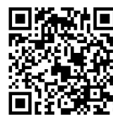
【小児ワクチンに関する動画】

八雲町では、お子様のワクチン接種を判断するための情報として動画を作成し、公開しています。ご活用ください。(すでに対象となる保護者の方には案内しています。)