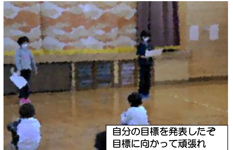
自分の目標を発表したぞ 目標に向かって頑張れ