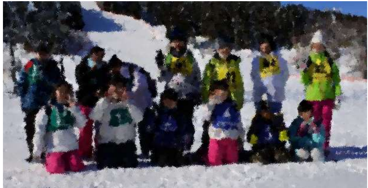
みんな楽しみにしていたスキー学習！ 滑走している子供たちはみんな笑顔です。