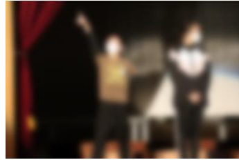
6年 2時50分からだよ！全員集合！！ ～ 6年生 修学旅行へ行く ～