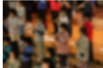
4年 私のお気に入り 2021