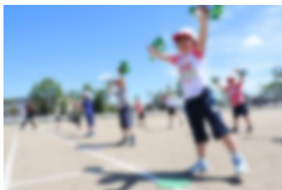
1年生 あいうえおんがく