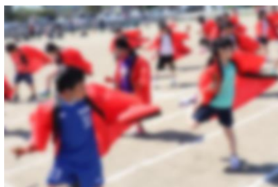
3年生 ハソソーラン