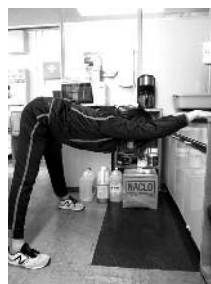
④肩と太もも裏のばし