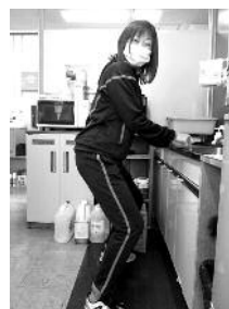
⑤ハーフスクワット

自宅で簡単にできる体操なので、日々の生活に取り入れ、寒い冬を元気に過ごしましょう!