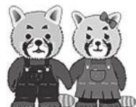
函館人権マスコット コウちゃん マイちゃん