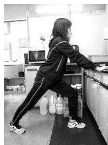
③ふくらはぎ伸ばし