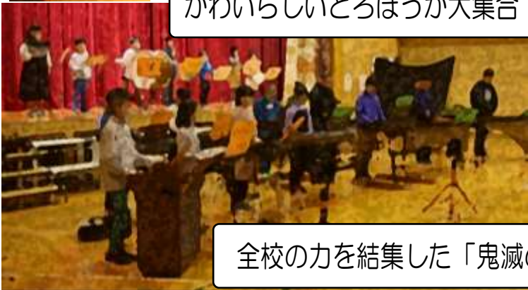
全校の力を結集した「鬼滅の刃」