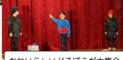
かわいらしいどろぼうが大集合