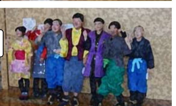
「みんなに笑顔を！」届けることができた学芸会でした。