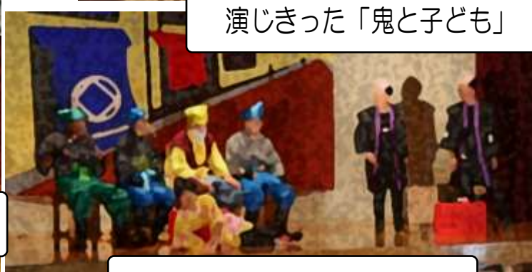
演じきった「鬼と子ども」