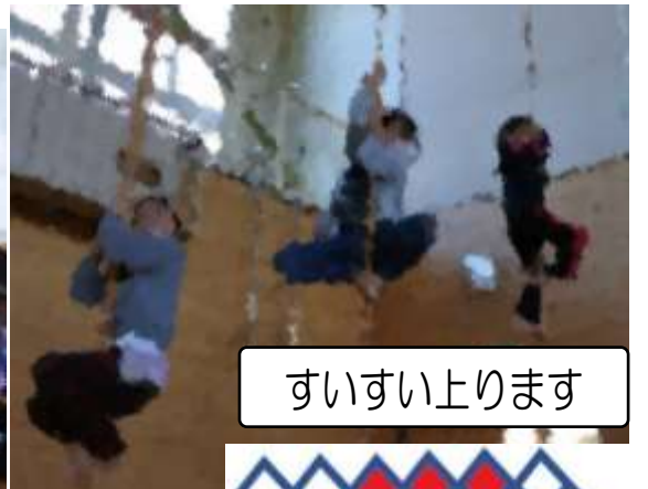
すいすい上ります