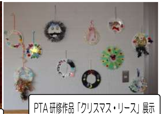
PTA 研修作品「クリスマス・リース」展示