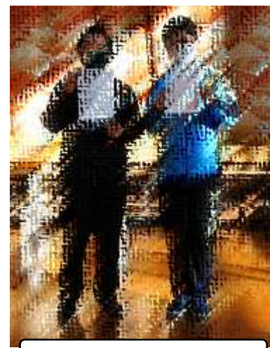
後期委員会委員長