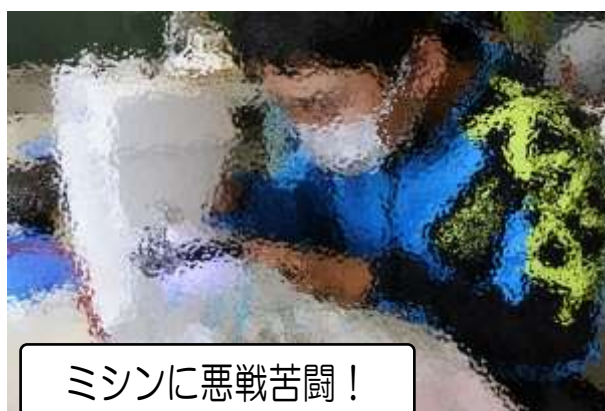
ミシンに悪戦苦闘!