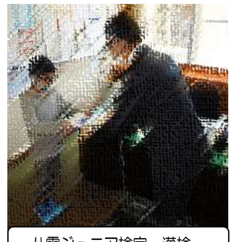
八雲ジュニア検定、漢検、 がんばりました