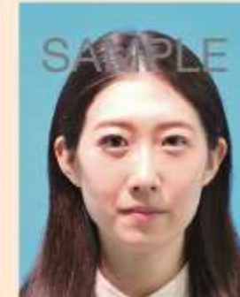
つけまつげ、まつげエクステの影