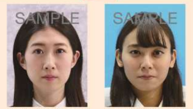
背景が柄模様であったり、凹凸のあるクロスが写りこんでいるもの 背景に異物が写りこんでいるもの