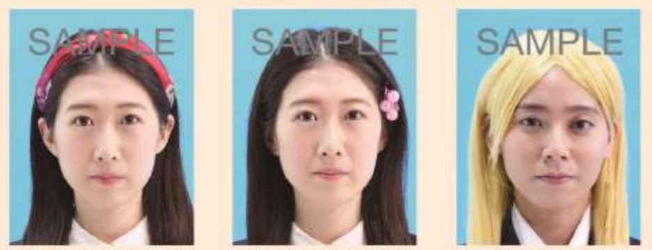
帽子やヘアバンドなどにより頭部が隠れているもの 装飾品で目・耳・鼻・唇などが隠れているもの カツラ(ウィッグ)などにより実際の容姿や雰囲気が変わるもの