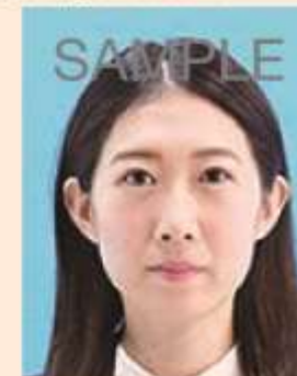
ジャギー(階段状のギザギザ模様)があるもの