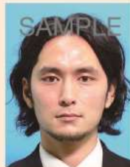
てかりやムラがあるもの