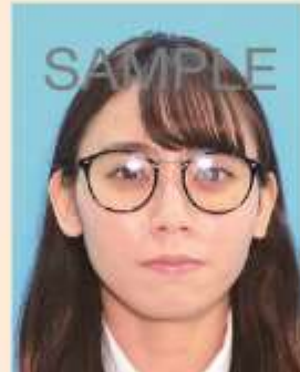
照明が眼鏡に反射したもの