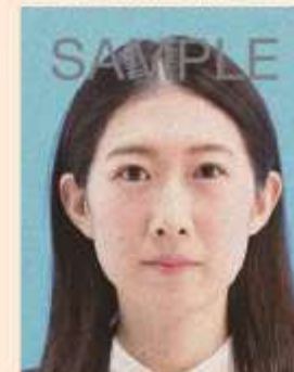
ノイズ(画像の乱れ)があるもの

デジタル画像の過剰な圧縮などが原因となってノイズ(画像の乱れ)が発生しているものや、ジャギー(階段状のギザギザ模様)、印刷時のドット(網状の点)やインクのにじみがあるものは不適当です。写真専用の用紙を使用し、鮮明な画質で印刷してください。