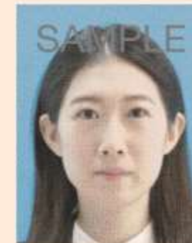
ドット(網状の点)やインクのにじみがあるもの