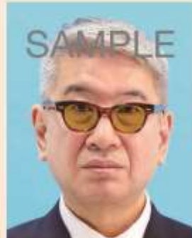
色付きの眼鏡やサングラス

より確実な本人確認のため、眼鏡を外した顔写真を推奨します。眼鏡を着用するとき、色付きのレンズや反射・影があるものは不適当です。また、目を妨げる縁・フレームがないものに限ります。医療上必要とされない限り、サングラスや処方のない色付きの眼鏡は不適当です。