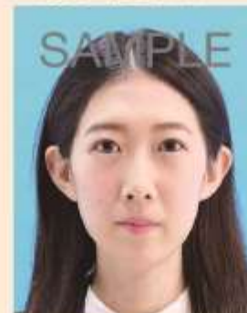
変形やマスクなどの画像処理をほどこしたもの