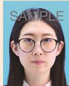
眼鏡のフレームが目にかかっているもの