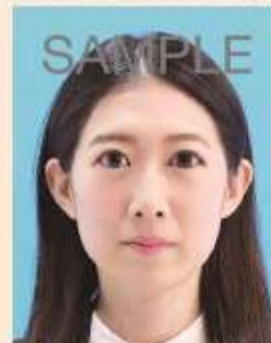
目を大きくしたり、顔のパーツが変形したもの

目を大きく見せたり、美白処理、顔パーツやほくろ、しわなどを修正するなどして、本人のイメージを変えることは、いかなる場合でも不適当です。また、左右反転※した写真は不適当です。