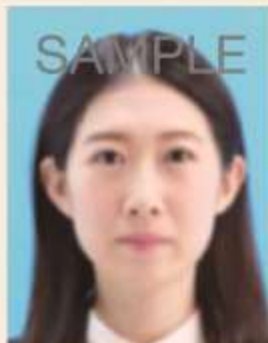
ピンぼけや手ぶれにより不鮮明なもの

撮影時にピントが合っていないかったり、手ぶれしてしまったため不鮮明なものや、顔にてかりやムラがあるものは不適当です。