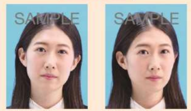
傾いているもの 横を向いているもの