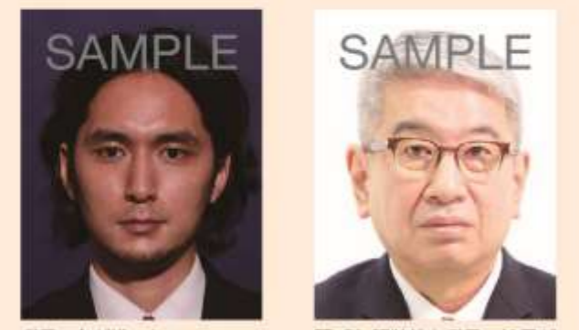
背景の色が濃いもの 頭、髪、服装等と背景の境界が不明瞭なもの