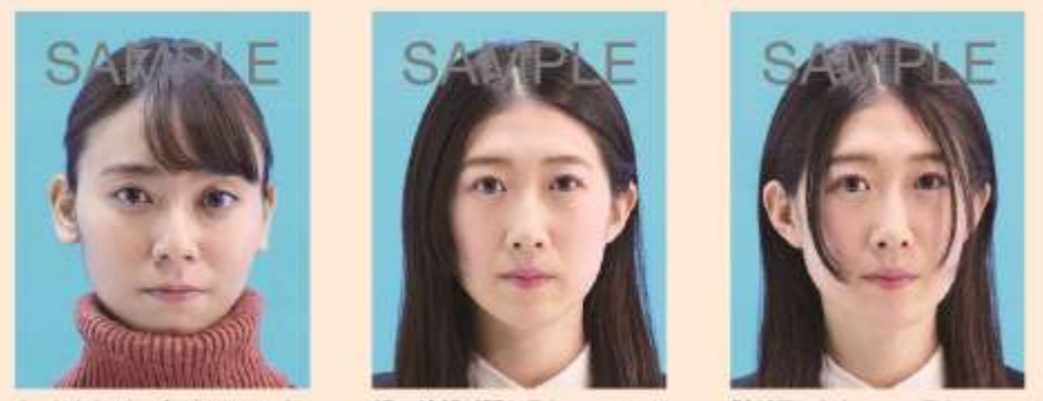
タートルネック、パーカーのフード、首を覆うもの、衣服などにより顔などの顔の一部が隠れているもの 顔の輪郭が隠れるもの 髪が目にかかっているもの