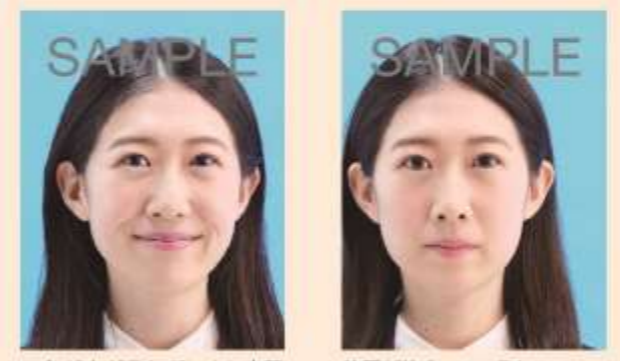
口角が上がるなどにより実際の容姿と著しく異なるもの 位置が片寄っているもの